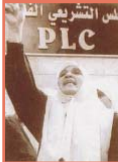
Para perempuan berdemonstrasi di luar gedung Dewan Legislatif Palestina, 1999

Hak-hak yang diuraikan di sini hanyalah beberapa dari jangkauan hak-hak luas yang menjadi hak kaum perempuan, yang juga mencakup hak terhadap kesehatan, kerja dan pendidikan.